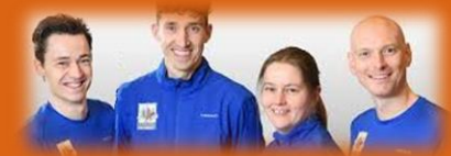
Team Buurtsport uitgebreid: meer mensen, meer mogelijk...