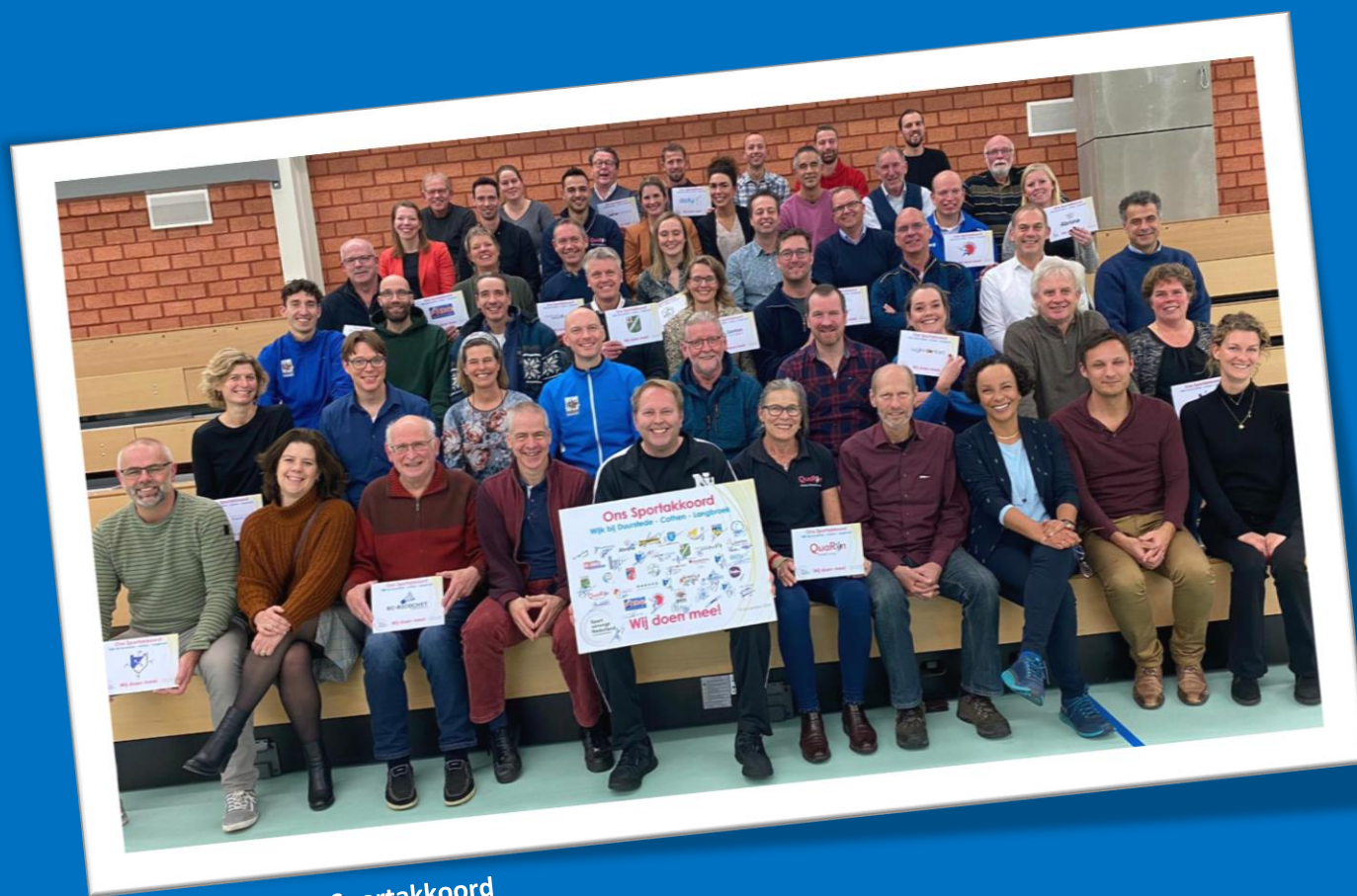
Samen voor óns Sportakkoord